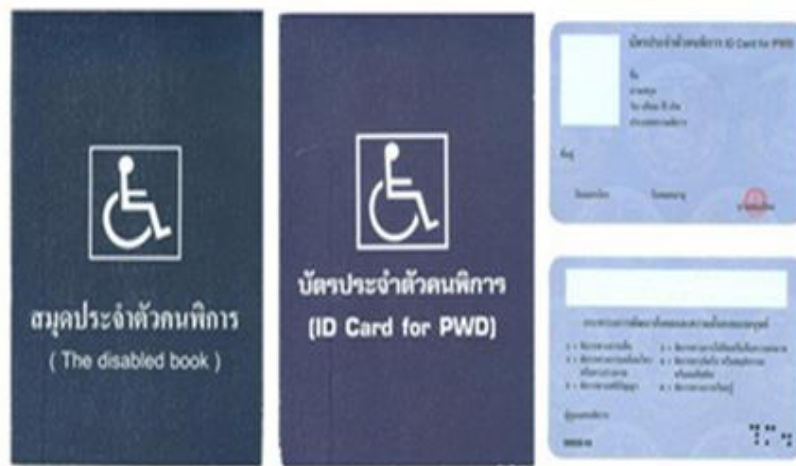
ตัวอย่างบัตรและสมุดประจำตัวคนพิการ