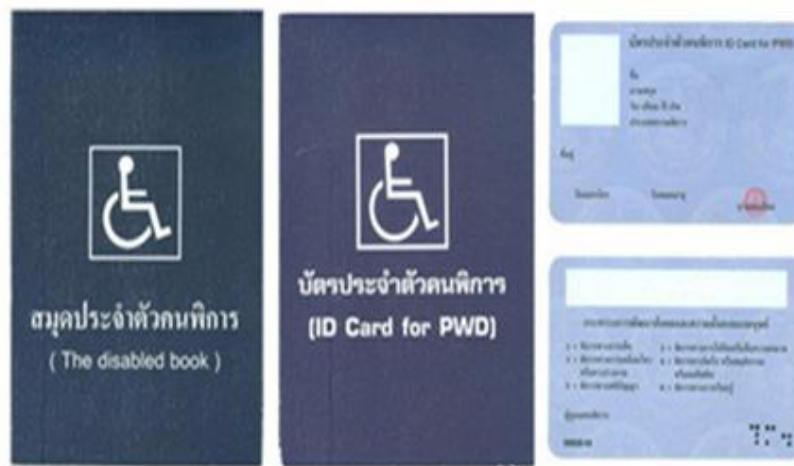
ตัวอย่างบัตรและสมุดประจำตัวคนพิการ